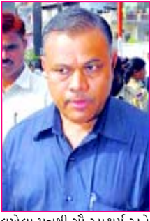
લખેલા પત્રથી સૌ આશ્ચર્ય અને ખળભળાટની બેવડી લાગણી અનુભવી રહ્યાં છે પરંતુ ઝડપિયાના આ દાવ પાછળ તેઓનું આયોજન શું છે ?

ગોરધન ઝડપિયાએ ચોક્કસ આયોજન સાથે જ પોતાને બોલાવવાની માંગ કરી (સંવાદદાતા દ્વારા) અમદાવાદ, તા.૪ કોમી તોફાનોની પુનઃ તપાસ કરતી એસ.આઈ.ટી.એ ઝડપિયા જાફરીની અરજીના અનુસંધાને રજૂ કરેલ તપાસ અહેવાલ બાદ સુપ્રીમ કોર્ટ પૂર્વ ગુજરાતમંત્રી ગોરધન ઝડપિયા, આઈ.પી.એસ. એમ.કે. ટંડન અને પી.બી. ગોંદિયાની ભૂમિકાની વધુનો તપાસનો આદેશ કર્યા બાદ ગોરધન ઝડપિયાએ તાજેતરમાં સામેથી એસ.આઈ.ટી.ને પત્ર પાઠવી પોતાની પૂછપરછ બોલાવવા માટે માંગ કરી છે ઝડપિયાએ એસ.આઈ.ટી.ને