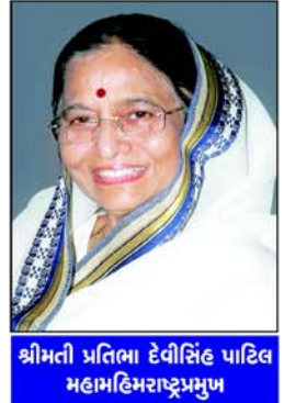
શ્રીમતી પ્રતિભા દેવીસિંહ પાટિલ મહામહિમાપૂર્વક પ્રમુખ

પ્રારંભિક શિક્ષણ હવે પ્રત્યેક બાળકનો મૌલિક અધિકાર છે