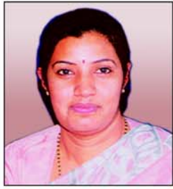
શ્રીમતી ડી. પુરંદેશ્વરી માનવ સંસાધન વિકાસ રાજ્ય પ્રધાન