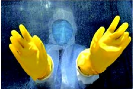
વેબસાઈટમાં કોરોનાના આ નવા લક્ષણો વિશે જાણકારી આપી છે. કોરોનાના હળવા લક્ષણોથી લઈને ગંભીર લક્ષણો વિશે તેણે જણાવ્યું છે. આ તમામ લક્ષણો વાયરસના સંપર્કમાં આવ્યા પછી ૧૪ દિવસની અંદર દેખાય છે. સીડીસીના જણાવ્યા મુજબ

તા. ૨૮ (એજન્સી) કોરોના વાયરસના સંક્રમણ જેટલી ઝડપથી દેશ અને દુનિયામાં ફેલાઈ રહ્યું છે, તે પતરનાક છે. દુનિયાભરના વૈજ્ઞાનિકો કોરોના વાયરસના લક્ષણોને શોધી તેનો ઉપાય શોધવાનો પ્રયાસ કરી રહ્યા છે. કોરોના વાયરસના પ્રકોપ વચ્ચે અમેરિકાના જાણીતા મેડિકલ વૈજ્ઞાનિકો આ મહામારીના નવા લક્ષણો અંગે જાણકારી આપી છે. રોગ નિયંત્રણ અને રોકથામ એટલે કે, સીડીસી જે દુનિયાભરની લેબમાં મળી રહેલા કોરોના વાયરસના લક્ષણો પર નજર રાખી રહી છે. તેણે કોરોના વાયરસના આ નવા લક્ષણો વિશે જાણકારી આપી છે. સીડીસીએ પોતાની