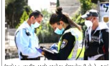
ઉપરોક્ત તસવીર કબજે કરાયેલા જેરુસલેમની છે કે, જ્યાં મુસાફરી કરી રહેલા તમામ લોકોના વાહનોની ઈઝરાયેલી પોલીસ દ્વારા તપાસ કરવામાં આવી રહી છે.

તેલ અવિવ, તા. ૨૮ ગતવર્ષે ચીનના વુહાન શહેરમાં ફાટી નીકળેલા કોરોના વાયરસનો કહેર આજે આખા વિશ્વમાં વાર્તાઈ રહ્યો છે. જીવલેણ કોરોના વાયરસ ખૂબ જ ચેપી હોવાથી દિવસેને દિવસે તેના કેસો અને તેની લપેટમાં આવનારા દર્દીઓના મૃત્યુઆંકમાં પણ વધારો થઈ રહ્યો છે. એવામાં દરેક દેશોમાં કોરોના વાયરસના પોઝિટિવ દર્દીઓ અને ક્વોરન્ટાઈન કરવામાં આવેલા દર્દીઓનું ટ્રેકિંગ કરવા માટે એપ્લિકેશનનો ઉપયોગ કરવામાં આવે છે, પરંતુ હવે ઈઝરાયેલે આ પ્રકારની એપ્લિકેશનના ઉપયોગ પર પ્રતિબંધ મૂકી દીધો છે. બીબીસીના જણાવ્યા અનુસાર,