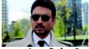
હાલમાં જ અભિનેતાની માતાનું નિધન થયું હતું