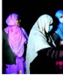
ઈન્ટરનેટ શટડાઉન કરી દેવાયું હતું, અખબારોના અવાજને દબાવી દેવાયો હતો અને શાળાઓ તેમજ લોકોની યથવળ બંધ કરી દેવાઈ હતી. ૨૫, માર્ચે ભારત સાથે શરૂ થયેલ બીજા લોકડાઉનમાં આ હુમલા વધુ સઘન બનાવાયાં છે. કેન્દ્રશાસિત પ્રશાસન હાલ

(એજન્સી) તા. ૨૮ આજકાલ કોરોના મહામારી દરમિયાન કાશ્મીરમાં શું ચાલી રહ્યું છે એ બહુ સાંભળવા મળતું નથી. પરંતુ તેમ છતાં હિંદુ શાસકો જમ્મુ-કાશ્મીરના કેન્દ્રશાસિત પ્રદેશનું નિર્માણ કરવામાં વ્યસ્ત છે. કાશ્મીર ખીણમાં લોકો માટે હજુ તેમના અધિકારોના દમનમાં કોઈ ઘટાડો થયો નથી. ભારતમાં લોકડાઉન પહેલા જમ્મુ અને કાશ્મીરમાં ૮ મહિના સુધી સંપૂર્ણ લોકડાઉન જોવા મળ્યું હતું. જો કે આ રાજકીય લોકડાઉન હતું જેમાં જમ્મુ અને કાશ્મીરના લોકોના બંધારણીય અને લોકતાંત્રિક અધિકારો પર હુમલા થયાં હતા. નાગરિકોના મૂળભૂત અધિકારો અને નાગરિક સ્વાતંત્ર્યને સંપૂર્ણપણે બંધ લાગી ગઈ હતી. હજારો રાજકીય નેતાઓ અને કર્મચીલોની ધરપકડ કરવામાં આવી હતી.