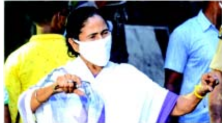
૧૯ના ફેલાવા સામે કામ લેવા એક કેબિનેટ સમિતિની પણ રચના કરવામાં આવી છે. આ સમિતિમાં પીએમ સલીમ લાયઝન અધિકારી રહેશે અને તેમાં પાર્થ ચેટરજી, ચંદ્રીમા ભટ્ટાચાર્ય અને ફીરહાદ હકીમનો સમાવેશ કરવામાં આવશે. પત્રકારો સાથેની વાતચીતમાં મમતા બેનરજીએ જણાવ્યું હતું કે કેન્દ્રે દુકાનોને ખોલવા માટેની મંજૂરી આપતો આદેશ કર્યો છે અને બીજા બાજુ રાજ્યોને લોકડાઉનનો કડક

તા. ૨૮ (એજન્સી) પ.બંગાળના મુખ્ય પ્રધાન મમતા બેનરજીએ સોમવારે જણાવ્યું હતું કે રાજ્યમાં બિનઆવશ્યક ચીજવસ્તુઓ અને સેવાની હોમ ડિલિવરી ૨૭, એપ્રિલથી શરૂ થશે. તેમણે ઉમેર્યું હતું કે રાજ્ય સરકાર મે, ૨૧ સુધીમાં તબક્કાવાર અને ઝોન પ્રમાણે લોકડાઉનમાં છૂટછાટ આપવાના પ્લાન પર કામ કરી રહી છે. જ્યારે લોકડાઉનનો નિર્ણય અને કેન્દ્ર સરકાર પર છોડ્યો છે. મુખ્ય પ્રધાન મમતા બેનરજીએ ઉમેર્યું હતું કે અમે સ્થાનિક લોકોને ઘરે જ રહેવા વિનંતી કરીએ છીએ અને માલસામાન અને સેવાઓની હોમ ડિલિવરી અને રાહત આપવાના ધોરણો પર કેન્દ્ર સરકારનો અભિપ્રાય જાણવા માગીએ છીએ. તેમણે જણાવ્યું હતું કે પ.બંગાળમાં કોવિડ-