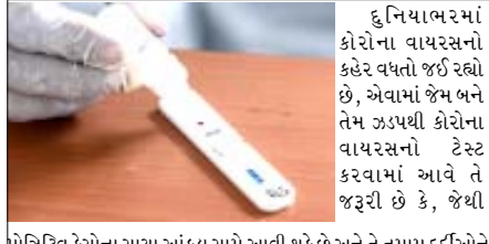
પોઝિટિવ કેસોના સાચા આંકડા સામે આવી શકે છે અને તે તમામ દર્દીઓને ઝાપટી સારવાર પણ પૂરી પાડી શકાય છે. કોરોના વાયરસની રેપિડ ટેસ્ટ કીટની પ્રતિકાત્મક તસવીર અહીં દર્શાવવામાં આવી છે.

રિયાધ, તા. ૨૮ રાજ્યને નવ મિલિયન જેટલો COVID-૧૯ની ટેસ્ટ કીટ્સ પૂરી પાડીને તેની કોવિડ-૧૯ની ટેસ્ટિંગ ક્ષમતા વધારવા માટે તેમજ આ મહામારી સામેની લડત લડવા માટે તેને અન્ય જરૂરી ઉપકરણો પૂરા પાડવા માટે ચીન દ્વારા રવિવારે સઉદી અરબ સાથે ૯૯૫ મિલિયન રિયાલ એટલે કે, ૨૬૫.૩ મિલિયન ડોલરના સોદા પર હસ્તાક્ષર કરવામાં આવ્યા હતા. તેમ સઉદી પ્રેસ એજન્સી (એસપીએ)એ તેના અહેવાલમાં જણાવ્યું છે. એસપીએના જણાવ્યા અનુસાર, આ સોદામાં સઉદીની મેડિકલ ટીમોને કોવિડ-૧૯ના