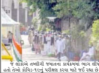
જે લોકોએ તબીબી જમાતના કાર્યક્રમમાં ભાગ લીધો હતો તેઓ કોવિડ-૧૯નું પરીક્ષણ કરવા માટે જઈ રહ્યા છે.

આમ ભ્રષ્ટાચાર, તબીબી તેમજ વહીવટી અવ્યવસ્થા, અરાજકતા કોરોના નહીં કોઈ પણ જંગ જીતવામાં આપણને પાછા પાડશે. કેન્દ્ર-રાજ્ય સરકારો બાજ નજર રાખી, મીડિયાએ જાહેર કરેલ આવી અવ્યવસ્થાનું ઝટ નિરાકરણ કરે. જેથી આપણા જીવનની રક્ષાતર ફરી પાછી હેમખેમ પાટા પર આવી જાય.