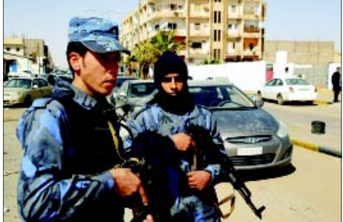
દક્ષિણ લિબિયાના સૌથી મોટાં શહેર સેબામાં જનરલ ખલીફા હફ્તારના વફાદાર દળો પેટ્રોલિંગ કરી રહ્યા હોવાની જાંખી ઉપરોક્ત તસવીરમાં જોઈ શકાય છે.

(એજન્સી) અબુધાબી, તા. ૨૮ માલ્ટાના ન્યાયતંત્રએ અમિરાતી કંપનીમાં કરાર આધારિત કામગીરી કરી રહેલા શસ્ત્રોના એક સ્થાનિક વેપારી પર લિબિયા પર લદાયેલા પ્રતિબંધોનું ઉલ્લંઘન કરવાનો આરોપ મૂક્યો હતો.