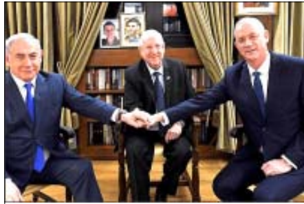
પ્રસ્તુત તસવીર ગત ૨૭ સપ્ટેમ્બર, ૨૦૧૯ના રોજ જેરુસલેમમાં આવેલા રાષ્ટ્રપતિના નિવાસ સ્થાન ખાતે લેવામાં આવી હતી, કે જ્યાં ઈઝરાયેલના વડાપ્રધાન બેન્જામિન નેતાન્યાહુ અને તેમના હરીફ બેની ગેન્ટ્સે રાષ્ટ્રપતિ રેઉવેન રિવલિન સાથે મુલાકાત કરી હતી.

તેલ અવિવ, તા. ૨૮ ઈઝરાયેલમાં આખરે એકતા સરકાર બન્યા બાદ હવે નવા મંત્રીમંડળમાં કોનો-કોનો સમાવેશ કરવો તે અંગે વિચારણા ચાલી રહી છે. એવામાં સ્થાનિક મીડિયાના અહેવાલોમાં એવો દાવો કરવામાં આવ્યો છે કે, વડાપ્રધાન બેન્જામિન નેતાન્યાહુની આગામી ઈઝરાયેલી સરકારમાં બ્લુ એન્ડ વ્હાઈટ પાર્ટીના પ્રધાનમંડળના ભાગ રૂપે લઘુમતીઓને લગતી બાબતો માટે અરબ પ્રધાનની નિમણૂક કરવામાં આવશે.