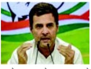
પ્રધાને મારા પ્રશ્નનો જવાબ આપવાનો ઈન્કાર કરી દીધો હતો. હવે આરબીઆઈએ નીરવ મોદી, મેહુલ ચોકસી સહિત ભાજપના 'મિત્રો'ના નામ બેંક ચોરો કે કોભાંડકારોની યાદીમાં નાખ્યા

(એજન્સી) નવી દિલ્હી, તા. ૨૮ કોંગ્રેસના નેતા રાહુલ ગાંધીએ ભારતીય બેંકો સાથે છેતરપિંડી કરનારા ટોચના ૫૦ વિલક્ષ્ણ ડિફેન્સ આરોપીઓની યાદી ભારતીય રિઝર્વ બેંક (આરબીઆઈ) દ્વારા જારી કરવામાં આવ્યા બાદ મંગળવારે સરકારને ઘેરી હતી. તેમણે જણાવ્યું કે, ૫૦ ડિફેન્સની યાદીમાં શાસક પક્ષ ભાજપના મિત્રોના નામ પણ સામેલ હોવાને કારણે ભાજપે આ યાદી સંસદથી છૂપાવી હતી. તેમણે ટિવટમાં કહ્યું કે, સંસદમાં મેં સીધો પ્રશ્ન પૂછ્યો હતો. મને દેશના ૫૦ સૌથી મોટા બેંક ચોરો કે કોભાંડકારોના નામ બતાવો; પરંતુ નાણાં