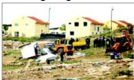
ગેરકાયદેસર વસાહતોનું વિસ્તરણ કરવા અને તેમાં રહેતા વસાહતીઓ માટે રસ્તો બનાવવા ઈઝરાયેલે પેલેસ્ટીનીઓના ઘરોને તોડી પાડ્યા હોવાનું ઉપરોક્ત તસવીરમાં જોઈ શકાય છે.

તેલ અવિવ, તા. ૨૮ આંતરરાષ્ટ્રીય કાયદાનું સ્પષ્ટપણે ઉલ્લંઘન કરતી અમેરિકી રાષ્ટ્રપતિ ડોનાલ્ડ ટ્રમ્પની “અપમાનજનક” ડીલ ઓફ ધ સેન્યુરી દ્વારા પ્રોત્સાહિત કરવામાં આવેલા પગલાંઓના ભાગરૂપે કબજે કરાયેલા વેસ્ટ બેંકના ભાગોને ઈઝરાયેલ સાથે જોડવાના તેમજ ગેરકાયદેસર વસાહતોનું વિસ્તરણ કરવાના ઈઝરાયેલના તાજેતરના પ્રયાસોની ઈરાન દ્વારા નિંદા કરવામાં આવી છે.