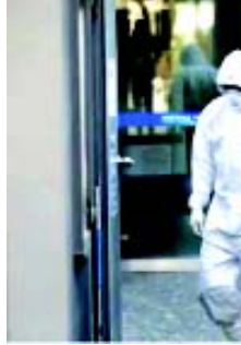
કે આ બધા લક્ષણો ૨થી ૧૪ દિવસમાં જોઈ શકાય છે. સીડીસીનું કહેવું છે કે કોરોના વાયરસવાળા લોકોને ઠંડી શકાય છે. સીડીસીએ જે નવા લક્ષણ જાહેર કર્યાં છે. તેમાં સામાન્ય ઈન્ફેક્શન થવા પર

(એજન્સી) નવી દિલ્હી, તા. ૨૮ કોરોના વાયરસના શરૂઆતનાં લક્ષણોમાં સુકી પાંસી, સખત તાવ આવવો અને શ્વાસ સાથે જોડાયેલી તકલીફો હતી. પરંતુ આ બીમારીનાં વધુ અન્ય લક્ષણો પણ સામે આવ્યા છે. જેને ખુદ અમેરિકાના હેલ્થ ઈન્સ્ટિટ્યૂટ સીડીસી (સેન્ટર્સ ફોર ડિસીઝ એન્ડ પ્રિવેન્શન) જાહેર કર્યાં છે. સીડીસીએ જણાવ્યું છે કે, ત્રણ મુખ્ય લક્ષણો સિવાય કોરોના વાયરસમાં આવા ઘણાં લક્ષણો છે, જેને હજી અવગણવામાં આવ્યા છે. સીડીસીએ આ રોગના છ નવા લક્ષણો જાહેર કર્યાં છે. અને તેના વૈજ્ઞાનિકોએ દાવો કર્યો છે