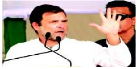
આવા મામલે દખલ કરે. રાહુલ ગાંધીએ ટ્વિટ કરતા કહ્યું કે, 'જ્યારે આખું દેશ કોવિડ-૧૯ સાથે લડી રહ્યું છે, ત્યારે કેટલાક લોકો ખોટી રીતે નફો કમાવવાનું છોડતા નથી. આ ભ્રષ્ટ માનસિકતા પર શરમ આવે છે, નફરત આવે છે. રાહુલ ગાંધીએ કહ્યું, અમે વડાપ્રધાનને માંગ કરીએ છીએ કે, આ નફાખોરી પર ઝડપી કડક કાર્યવાહી કરવામાં આવે, જેમને જે સમાચારનો હવાલો આપ્યો, તેમને જે સમાચારનો હવાલો આપ્યો છે, તે અનુસાર આઈસીએમઆરને વેચવામાં આવેલી ચીનથી આયાત કરેલ કોવિડ-૧૯ ટેસ્ટ કિટમાં ખૂબ જ મોટો નફો લીધો છે. આ કિટની કિંમત ભારતમાં આયત ખર્ચ સાથે ૨૪૫ રૂપિયા છે, તેની આને આઈસીએમઆરને ૬૦૦ રૂપિયા

તા. ૨૮ (એજન્સી) કોરોના પૂર્વ અધ્યક્ષ અને કેરળના વાચનાડથી સાંસદ રાહુલ ગાંધીએ કોરોના વાયરસની તપાસ માટે ચીનથી લાવેલી કિટ ઉપર 'નફાખોરી'ના દાવાવાળા સમાચારોને લઈને પીએમને નફો કરનારાઓ પર કાર્યવાહી કરવાની માંગ કરી છે. તેમને એક સમાચારના હવાલો આપતા ટ્વિટ કર્યો હતો અને કહ્યું હતું કે, કેટલાક લોકો સરકારને કોવિડ-૧૯ની ટેસ્ટ કિટ વેચીને નફો કમાઈ રહ્યા છે. લોકો આશરે ૧૫૦ ટકા વધુ નફો રળી રહ્યા છે. દેશ જ્યારે મુશ્કેલીમાં છે, ત્યારે એવા સમયે પણ નફો રળનારા આવા લોકો વિરુદ્ધ કાર્યવાહી કરવા માટે વડાપ્રધાન મોદીને મારી અપીલ છે કે, તેઓ