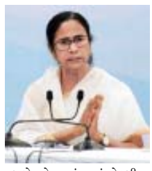
તબક્કે ઓછા અંતરમાં એકબીજા સાથે સંપર્કમાં આવેલા અને વધુ બીડમાં રહેલા લોકો ઘરમાં જ ક્વોરન્ટાઇન થઈ શકે છે. આ ઉપરાંત તેમણે બીજાઓ સાથે

તા. ૨૮ (એજન્સી) કોલકાતા, પશ્ચિમ બંગાળના મુખ્યમંત્રી મમતા બેનરજીએ જણાવ્યું છે કે, જે લોકો કોરોના પોઝિટિવ દર્દીના સંપર્કમાં આવ્યા હોય પરંતુ નિશ્ચિત અંતર રહી હોય તો તેઓ ઘરમાં જ આઈસોલેટ થઈ શકે. જો આ લોકો સરકાર સંચાલિત ક્વોરન્ટાઇન સુવિધા મેળવવા માંગતા હોય તો તેઓને હોસ્પિટલમાં સ્ટ્રિક કરી શકાય. ઉલ્લેખનીય છે કે, આઈસોલેશનમાં રાખવા એટલે કે, દર્દીને કોરોના પોઝિટિવ ગણવામાં આવતો નથી. મમતા બેનરજીએ જણાવ્યું હતું કે, પ્રાથમિક અને બીજા