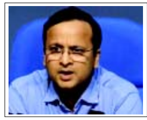
પ્લાઝમા થેરેપીની અસરનો અભ્યાસ કરવામાં આવશે. તેમણે એવું પણ કહ્યું કે ગાઈડલાઈન્સનું યોગ્ય રીતે પાલન

(એજન્સી) નવી દિલ્હી, તા. ૨૮ કોરોના વાયરસને પહોંચીવળવા અંગે પ્લાઝમા થેરેપીને એક આશાના કિરણ તરીકે જોવામાં આવી રહ્યું છે. દિલ્હી સહિત કેટલાક રાજ્યોએ દર્દીઓને આ થેરેપી આપવાની શરૂઆત પણ કરી દીધી છે. જ્યારે કેન્દ્ર સરકારે આ બાબતે એલર્ટ કરતા જણાવ્યું છે કે આ થેરેપીને હાલમાં ઈન્ડિયાના કોઈ સ્થાને ઓફ મેડિકલ રિસર્ચ (આઈસીએમઆર) તરફથી મંજૂરી આપવામાં આવી નથી. પ્લાઝમા થેરેપીને હાલમાં માત્ર ટ્રાયલ અને રિસર્ચના સ્વરૂપમાં અજમાવી શકાય છે. દિલ્હીમાં પ્રથમ સફળ ટેસ્ટથી પ્લાઝમા થેરેપીથી આશા વધી ગઈ છે. સરકારે જણાવ્યું છે કે કોરોના વાયરસ માટે પ્લાઝમા થેરેપી હજી પ્રાયોગિક તબક્કાએ છે અને દર્દી માટે જીવનું જોખમ પુરવાર થઈ શકે છે.