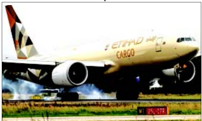
પ્રસ્તુત તસવીરમાં ઈતિહાદ એરવેઝના વિમાનને જોઈ શકાય છે.

(એજન્સી) અબુધાબી, તા. ૨૮ સંયુક્ત અરબ અમીરાત (યુએઈ)એ પોતાની તમામ ફ્લાઈટ્સને આગામી ૧૬ મે સુધી રદ કરવાનો નિર્ણય કર્યો છે. ઈતિહાદ એરવેઝે કહ્યું છે કે, કોરોના વાયરસને કારણે આ ફ્લાઈટ્સને રદ કરવામાં આવી છે.