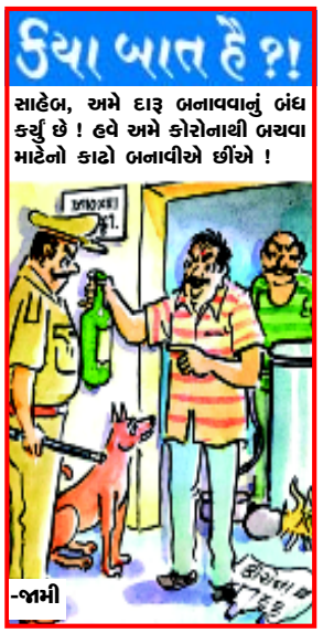
કોવિડ-૧૯ના સંક્રમણને રોકવા માટે લોકોને સાવચેત રાખવા માટે આવા ચિત્રો તૈયાર કરવામાં આવે છે.

દલીલ કરી હતી કે મેટરિક્સ લેબ્સ સાથે થયેલા કરાર મુજબ કોઈ બીજી કંપની તેનું ભારતમાં માર્કેટિંગ ન કરી શકે. કંપનીએ આ પણ કહ્યું હતું કે, તેણે પહેલાં જ રૂ. ૧૨.૭૫ કરોડ ચૂકવી દીધા છે. રેર મેટાબોલિક્સે આ પણ ખાતરી આપી હતી કે તેને પૈસા મળશે કે તરત જ તે મેટરિક્સ લેબને પૈસા ચૂકવી દેશે. મેટરિક્સ લેબ્સે તેના બાકીના પૈસા માંગતા આ વિવાદ ઊભો થયો હતો જ્યારે અરજદારે કહ્યું હતું કે, જ્યારે આઈસીએમઆર તેને પૈસાની ચૂકવણી કરે ત્યારબાદ જ તે મેટરિક્સ લેબને પૈસા આપશે. અરજદારે કોર્ટને આ પણ જણાવ્યું હતું કે, ૨.૭૬ લાખ રેપિડ ટેસ્ટ કિટ આઈસીએમઆરને સંપ્લાય કરી દેવામાં આવી છે જેના પૈસા હજી બાકી છે. આ પૈસાની ચૂકવણી ત્યારે જ થશે જ્યારે ટેસ્ટિંગ કિટો આઈસીએમઆરના માપદંડો મુજબ આદેશ આ કિટોમાં ખાલી નીકળતા આઈસીએમઆરને ટેસ્ટિંગ રોકી દીધું હતું. દિલ્હી હાઈકોર્ટે તેના આદેશમાં કહ્યું હતું કે, આ એક કિટમાં નફો ૧૫૫ રૂપિયા છે જે પડતર કિંમત રૂ. ૨૪૫માં ૬૧ ટકા જેટલું છે. આ નફો પૂર્ણ જ વધારે છે. હાલના વૈશ્વિક મહામારીના સંજોગોમાં જ્યારે દેશમાં તાત્કાલિક વિપુલ પ્રમાણમાં ટેસ્ટ કરવાની જરૂર છે. ત્યારે આટલો ઉંચો નફો ન હોવો જોઈએ. હવેથી જીએસટી સહિત આ કિટને રૂ. ૪૦૦ના ભાવે વેચવામાં આવે. દિલ્હી હાઈકોર્ટેના આદેશ પછી બન્ને કંપનીઓ આ રેપિડ ટેસ્ટિંગ કિટને રૂ. ૪૦૦ના ભાવે વેચવા તૈયાર થઈ હતી. બન્ને પક્ષોને સાંભળ્યા પછી દિલ્હી હાઈકોર્ટે આ પણ કહ્યું હતું કે, બાકીની ૨.૨૪ લાખ કિટો જેવી ભારત પહોંચે કે તરત જ તેમને આઈસીએમઆરને આપી દેવામાં આવે અને અરજદાર આઈસીએમઆર પાસેથી પૈસા મળવા તેના ૨૪ કલાકમાં મેટરિક્સ લેબ્સને રૂ. ૮.૨૫ કરોડ ચૂકવવામાં આવે.