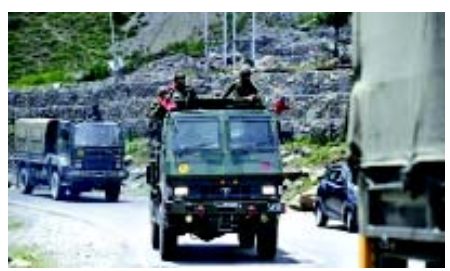
અમેરિકન નેતા ડેડ યોહોએ કહ્યું છે કે હવે સમય આવી ગયો છે કે દુનિયા ભેગા થાય અને ચીનને કહે કે હવે બહુ થયું છે. ટેડ યોહોએ શુક્રવારે કહ્યું હતું કે, "ભારત સામેની કાર્યવાહી કોરોના રોગચાળા

(એજન્સી) તા. ૨૭ લદાખમાં એલએસી ખાતે ગેલવાન પીણામાં ચીન સાથેની હિંસક અથડામણમાં ભારતીય જવાનોની શહાદત બાદ અમેરિકા ભારતના સમર્થનમાં બહાર આવ્યું છે. એક અમેરિકન નેતાએ કહ્યું છે કે પૂર્વી લદાખમાં ચીનની તાજેતરની આક્રમકતા તેના પડોશીઓ વિરૂદ્ધ મોટા પાયે લશ્કરી ઉશ્કેરણીનો ભાગ છે. શાંતિપૂર્ણ રાષ્ટ્રોના ૩૨ અને સૈન્ય કાર્યવાહી માટે અમેરિકા ચીન સાથે ઊભું નહીં રહેશે. આ વાત અમેરિકાના પ્રભાવશાળી નેતા ડેડ યોહો દ્વારા કરવામાં આવી