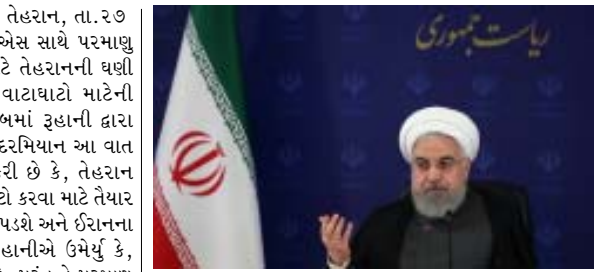
પ્રસ્તુત તસવીરમાં ઈરાનના રાષ્ટ્રપતિને જોઈ શકાય છે. ઈરાનના રાષ્ટ્રપતિ હસન રૂહાનીએ ગત ૬ જૂન, ૨૦૨૦ના રોજ ઈરાનના તેહરાનમાં કોરોના વાયરસ સામેની રાષ્ટ્રીય લડાઈ બોર્ડની એક બેઠકમાં રોગચાળાની પ્રક્રિયા અંગેના તાજેતરના વિકાસ અંગે નિવેદનો આપ્યા હતાં.

(એજન્સી) તેહરાન, તા. ૨૭ ઈરાનના રાષ્ટ્રપતિ હસન રૂહાનીએ યુએસ સાથે પરમાણુ કારરની વાટાઘાટોને પુનઃ શરૂ કરવા માટે તેહરાનની ઘણી શરતોને નક્કી કરી છે. ઈરાન સાથેની વાટાઘાટો માટેની તૈયારીઓના અમેરિકા નિવેદનોના જવાબમાં રૂહાની દ્વારા બુધવારે એક સરકારી બેઠકમાં ભાગ લેવા દરમિયાન આ વાત જણાવવામાં આવી છે. રૂહાનીએ પુષ્ટિ કરી છે કે, તેહરાન વોશિંગ્ટન સાથે P5 + 1 દેખાવ પર વાટાઘાટો કરવા માટે તૈયાર છે, પરંતુ તે પહેલા વોશિંગ્ટનને માફી માંગવી પડશે અને ઈરાનના નુકસાનની ભરપાઈ પણ કરવી પડશે. રૂહાનીએ ઉમેર્યું કે, “યુએસ સાથેની વાટાઘાટોનો માર્ગ સરળ છે, પરંતુ તે પરમાણુ કારરમાં યુ.એસ.ના પરત ફરવા પર અને તેમની તમામ જવાબદારીઓના અમલીકરણ પર પણ આધારિત છે. તેમણે વધુમાં કહ્યું કે, “જો યુ.એસ. ગંભીર છે અને વાટાઘાટો માટેના તેમની હાકલ વિશે ખોટું નથી બોલી રહ્યું, તો તેનો માર્ગ મોકળો થશે, પરંતુ વોશિંગ્ટનને આ બધા નિવેદનોને બદલે, માફી માંગવી જોઈએ અને આંતરરાષ્ટ્રીય નિષ્ણંદોનો અમલ કરવો જોઈએ. વોશિંગ્ટન દ્વારા આ તમામ બાબતોને અનુસરવામાં આવશે તે