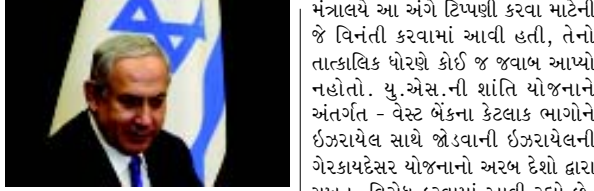
ઉપરોક્ત તસવીરમાં ઈઝરાયેલી વડાપ્રધાન બેન્જામિન નેતાન્યાહુને જોઈ શકાય છે.

(એજન્સી) તેલ અવિવ, તા. ૨૭ ગત રિસેમ્બર મહિનામાં ચીનના વુહાન શહેરમાં ફાટી નીકળેલા કોરોના વાયરસનો કહેર આજે આખા વિશ્વમાં વર્તાઈ રહ્યો છે, ત્યારે ઈઝરાયેલી વડાપ્રધાન બેન્જામિન નેતાન્યાહુએ ગુરુવારે કહ્યું છે કે, ઈઝરાયેલ અને સંયુક્ત અરબ અમીરાત (યુએઈ) કોરોના વાયરસ સામેની લડતમાં સહકાર આપશે. શક્ય છે કે, આવા સહકારને કારણે પાણીના અરબ દેશોની સાથે સંબંધોને સામાન્ય બનાવવાના ઈઝરાયેલના પ્રયત્નોને વેગ મળે. નેતાન્યાહુએ કહ્યું કે, કોવિડ-૧૯ના રોગચાળાનો સામનો કરવા માટે યુએઈ સાથે મળીને કામ કરવાની ઔપચારિક