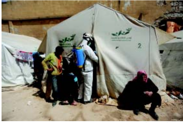
પ્રસ્તુત તસવીરમાં કેમ્પમાં તંબુ બાંધીને રહેતા સીરિયન શરણાર્થીઓને જોઈ શકાય છે. કોરોના વાયરસની મહામારીના આ સમયગાળા દરમિયાન, શરણાર્થીઓના કેમ્પને પણ જંતુમુક્ત કરવામાં આવી રહ્યાં છે.

(એજન્સી) દમાસ્કસ, તા. ૨૭ ગત રિસેમ્બર મહિનામાં ચીનના વુહાન શહેરમાં ફાટી નીકળેલા કોરોના વાયરસનો કહેર દિવસે-દિવસે વધી રહ્યો છે. એવામાં હવે સંયુક્ત રાષ્ટ્ર (યુ.એન.) દ્વારા જણાવવામાં આવ્યું છે કે, સીરિયામાં વધી રહેલા ભૂખમરાના સંકટને કારણે અહીં કોરોના વાયરસનો પ્રકોપ વધે તેવી શક્યતા છે.