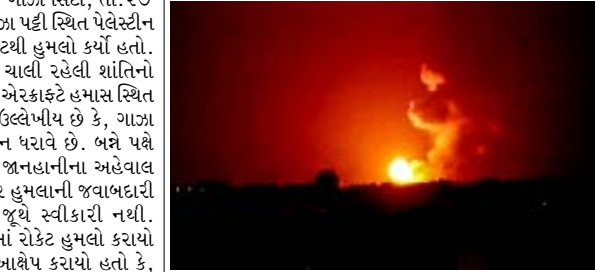
દ્વારા પશ્ચિમ કાંઠાને ખાસ કરીને મહત્વની જોડિર વેલીને જોડવા માટેની યોજનાને પગલે પેલેસ્ટીન સાથે છાશવારે ઘર્ષણ થતું જોવા મળે છે. ઈઝરાયેલની આ યોજનાને પગલે પેલેસ્ટીનની પશ્ચિમ કાંઠામાં ગાઝા પટ્ટી સ્થિત રાજ્ય સ્થાપવાની આશા પર પાણી ફરી વળશે.

(એજન્સી) ગાઝા સિટી, તા. ૨૭ ઈઝરાયેલના લશ્કરે દાવો કર્યો છે કે, ગાઝા પટ્ટી સ્થિત પેલેસ્ટીન દળોએ શુક્રવારે દક્ષિણ ઈઝરાયેલમાં બે રોકેટથી હુમલો કર્યો હતો. આ હુમલા સાથે જ છેલ્લા એક મહિનાથી ચાલી રહેલી શાંતિનો ભંગ થયો છે. વળતા જવાબમાં ઈઝરાયેલના એરક્રાફ્ટે હમાસ સ્થિત બે સૈન્ય ઠેકાણાઓ પર હુમલો કર્યો હતો. ઉલ્લેખીય છે કે, ગાઝા સ્થિત ઈસ્લામિક જૂથ હમાસ પોતાનું શાસન ધરાવે છે. બન્ને પક્ષે થયેલા સામસામા હુમલાની ઘટનામાં કોઈ જાનહાનીના અહેવાલ પ્રાપ્ત થયા નથી. આ ઉપરાંત ઈઝરાયેલ પર હુમલાની જવાબદારી હજી સુધી કોઈ પેલેસ્ટાઈનના આતંકી જૂથ સ્વીકારી નથી. ઈઝરાયેલના દક્ષિણ ભાગમાં પુલ્લી જગ્યામાં રોકેટ હુમલો કરાયો હતો. હમાસ દ્વારા એક દિવસ પૂર્વે એવો આક્ષેપ કરાયો હતો કે, ઈઝરાયેલના વિમાન દ્વારા ગાઝા પટ્ટીના પશ્ચિમ છેડે કેટલાક ભાગમાં કબજો કર્યો છે અને તેઓ વિમાન દ્વારા હુમલાઓ કરી રહ્યા છે. ત્યારબાદ પેલેસ્ટીન જૂથ ઈઝરાયેલ પર બે રોકેટ છોડતા એક માસથી ચાલી રહેલી શાંતિ ફરી ડહોળાઈ છે. ઈઝરાયેલના મતે હવાઈ હુમલાથી હમાસની ભાવિ ઘમતા હણાશે. ઈઝરાયેલ