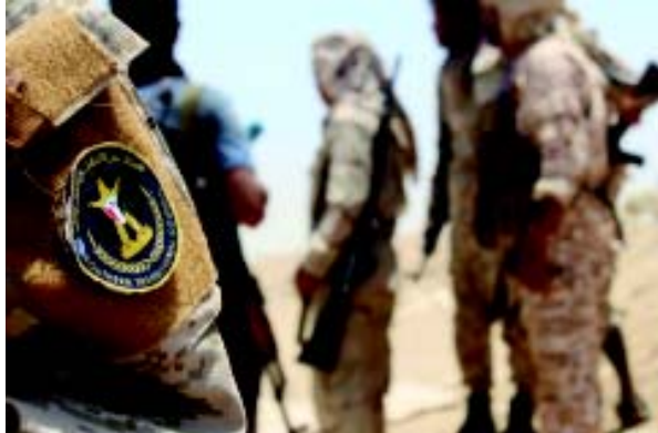
સાઉથન ટ્રાન્ઝિશનલ કાઉન્સિલ (એસટીસી)ના હડવૈયાઓ ગત ૧૨ મે, ૨૦૨૦ના રોજ દક્ષિણ અબ્યાન પ્રાંતના શેખ સલીમ વિસ્તારમાં સઉદી સમર્થિત સરકારી દળો સાથે અથડામણ થઈ હતી તે દરમિયાન ભેગા થયા હતા, તે વેળાની તસવીરને અહીં જોઈ શકાય છે.

(એજન્સી) સના, તા. ૨૭ યમનના એક ભૂતપૂર્વ વરિષ્ઠ અધિકારીએ ગુરુવારે કહ્યું કે, સઉદી અરબર અને ઈરાન અને સંયુક્ત અરબ અમીરાત (યુએઈ) માટેના યુદ્ધને યમનમાં હારી ગયું છે. આ વિગતો એનાદોલુ એજન્સીના અહેવાલમાં જણાવવામાં આવી છે. ભૂતપૂર્વ પરિવહન પ્રધાન સાલેહ અલ્લાબવાનીએ ટ્વીટ કર્યું કે, “જ્યારે અમે યમનની યુદ્ધમાં પ્રાદેશિક શક્તિઓના પ્રદર્શનનું મૂલ્યાંકન કરી રહ્યાં હતાં, ત્યારે અમને જાણવા મળ્યું કે, આ યુદ્ધમાં ઈરાન અને યુએઈને લાભ થયો છે અને સઉદી અરબ આ યુદ્ધને હારી ગયું છે. ગત એપ્રિલ મહિનામાં, અલ્લાબવાનીએ તેમને તેમના પદ પરથી સસ્પેન્ડ કરવાના નિર્ણયના વિરોધમાં રાષ્ટ્રપતિ અબ્દરબ્બુહ મન્સુર હાદીને તેમનું રાજીનામું સુપરત કર્યું હતું. પૂર્વ મંત્રીએ વડાપ્રધાન મઈન અબ્દુલમલિક પર “યુએઈ સમર્થિત સાઉદીન ટ્રાન્ઝિશનલ કાઉન્સિલને સમર્થન આપવાનો આરોપ લગાવ્યો હતો. યમન વર્ષ ૨૦૧૪થી હિંસાથી ઘેરાયેલું છે, જ્યારે