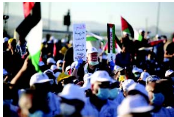
પ્રસ્તુત તસવીરમાં માસ્ક પહેરીને ઈઝરાયેલના કબજાનો વિરોધ કરી રહેલા પ્રદર્શનકારીઓને જોઈ શકાય છે. ઈઝરાયેલના વડાપ્રધાન બેન્જામિન નેતાન્યાહુ દ્વારા અગાઉ એવી ઘોષણા કરવામાં આવી હતી કે, તેઓ આગામી ૧ જુલાઈથી વેસ્ટ બેંકના ભાગો પર કબજો કરવાની પ્રક્રિયા શરૂ કરશે.

(એજન્સી) બ્રસેલ્સ, તા. ૨૭ ઈઝરાયેલ દ્વારા પેલેસ્ટીનના જુદાં-જુદાં વિસ્તારો પર કબજો કરવામાં આવતો હોવાની ઘટનાઓ અવાર-નવાર સામે આવતી રહે છે. એવામાં હવે બેલ્જિયમ પણ ઈઝરાયેલની આ યોજનાનો વિરોધ કરતાં યુરોપિયન યુનિયનને એવી હાકલ કરી છે કે, જો ઈઝરાયેલ દ્વારા વેસ્ટ બેંક પર કબજો કરવામાં આવે તો તેના પર પ્રતિબંધ મૂકવામાં આવે.