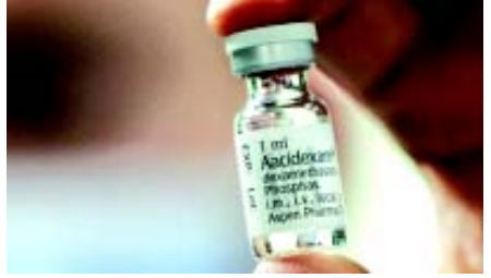
મેથિલેપ્રેડનિસોલોન ના વિકલ્પ તરીકે ઓછી કિંમતના સ્ટીરોઈડ ડ્રગ (Steroid Drug) ડેક્સામેથાસોન (Dexamethasone)ના ઉપયોગને મંજૂરી આપી છે.

(એજન્સી) તા. ૨૭ ભારતમાં અનલોક-૧ પછી કોરોનાના કેસ ઘણા મોટા પ્રમાણમાં વધી રહ્યા છે. આપણા દેશમાં પાછલા કેટલાક દિવસોમાં કોરોનાના કેસોમાં મોટો ઉછાળો જોવા મળ્યો છે. ૩૧ મેના રોજ આપણા દેશમાં કુલ કેસોની સંખ્યા ૧,૯૦,૦૦૦ની આસપાસ હતી. આપણે ફક્ત ૨૭ દિવસમાં ૧,૯૦,૦૦૦થી ૨૭ જૂને સાંજે ૫ વાગ્યા સુધી ૫,૦૮,૦૦૦ જેટલા કેસ પર પહોંચ્યા છીએ. જો આરોગ્ય વિભાગ દ્વારા અપાતા આંકડાઓને સાચા અને સંપૂર્ણ પામીરહિત માની લઈએ તો પણ આજે દેશમાં કુલ કેસ ૫,૧૧,૪૭૮, જેમાંથી સક્રિય કેસ ૧,૯૮,૬૭૬, અને ૧૫,૭૩૧ આટલા લોકોએ કોરોનાના લીધે જીવ ગુમાવ્યો છે. સરકારી આંકડાઓ મુજબ અત્યાર સુધી ૨,૯૭,૦૧૧ દર્દીઓ સાજા થયા છે.