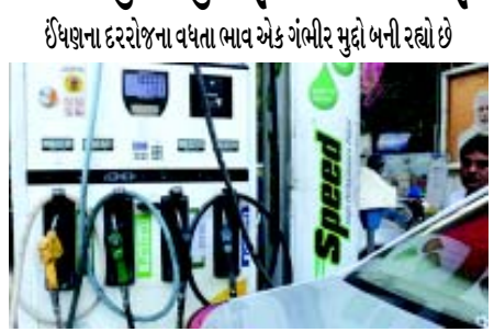
ઈંધણના દરરોજના વધતા ભાવ એક ગંભીર મુદ્દો બની રહ્યો છે

(એજન્સી) નવી દિલ્હી, તા. ૨૭ પેટ્રોલ અને ડીઝલના વધતા ભાવ દિવસે દિવસે ગંભીર મુદ્દો બની રહ્યા છે. આંતરરાષ્ટ્રીય માર્કેટમાં કાચા તેલના ભાવમાં ઘટાડો હોવા છતાં આજે સતત ૨૧મા દિવસે પેટ્રોલ અને ડીઝલના ભાવમાં વધારો ઝીંકાયો છે. આજે ડીઝલ ૨૧ પૈસા જ્યારે પેટ્રોલના ભાવમાં ૨૫ પૈસાનો વધારો નોંધાયો છે. આ સાથે છેલ્લા ૨૧ દિવસમાં ડીઝલ કુલ ૧૧ રૂપિયા અને પેટ્રોલ કુલ ૯.૧૨ રૂપિયા મોંઘું થયું છે. પેટ્રોલની કિંમતથી વધુ ડીઝલના ભાવ વધુ થતા લોકો દ્વારા અલગ-અલગ પ્રતિક્રિયા