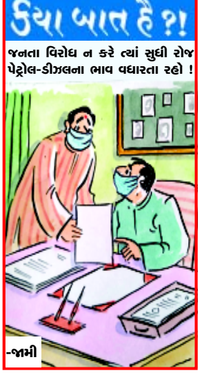
જનતા વિરોધ ન કરે ત્યાં સુધી રોજ પેટ્રોલ-ડીઝલના ભાવ વધારતા રહો!