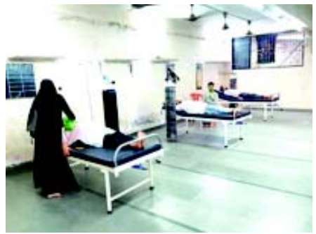
મક્કા મસ્જિદમાં તૈયાર કરવામાં આવેલા ઓક્સિજન સેન્ટર.

(એજન્સી) તા. ૨૭ ભિવંડીના હિન્દુભાઈઓએ મસ્જિદમાં પ્રવેશવાનું ક્યારેય વિચાર્યું નહીં હોય પરંતુ હાલ એક મસ્જિદમાં તેમની સારવાર થઈ રહી છે. ભિવંડીની મક્કા મસ્જિદમાં ૧૨ દિવસ પહેલા ઓક્સિજન સેન્ટર શરૂ કરવામાં આવ્યું હતું. અહીં ૧૧૩ જેટલા દર્દીઓ સારવાર માટે દાખલ થયા હતા જેમાંથી ૨૭ હિન્દુભાઈઓ છે. પાવરલુમ નગર તરીકે ઓળખાતા ભિવંડીમાં હિન્દુઓની વસ્તી ૩૮ ટકા છે જ્યારે મુસ્લિમોની વસ્તી ૫૬ ટકા છે. વર્ષોથી ભિવંડીને કોમી તંગદિલીનો પથથા ગણવામાં આવે છે. ૧૯૭૦ અને ૧૯૮૪માં અહીં મોટા પાયે કોમી રમખાણો થયા હતા. ૧૯૮૪ના રમખાણો પછી અહીં મોહલલા કમિટિ અભિયાનની શરૂઆત થઈ