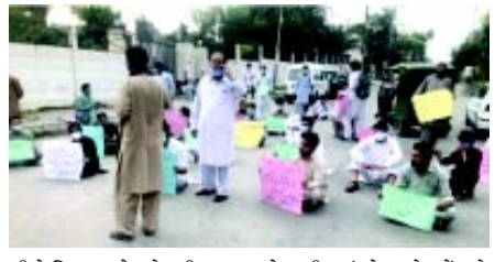
બીજો દિવસ હતો. એસપી સદર સર્કલ એ.એસ.પાલિદે જણાવ્યું કે, પ્રદર્શનકારીઓના ભેગા થયાના તરત પછી સ્થિતિને નિયંત્રણમાં લેવામાં આવી. પ્રદર્શનકારી રાજકીય વિધાનસભાની ઈમારતની બહાર પણ ભેગા થયા અને પોલીસના અત્યાચારની વિરૂદ્ધ પ્રદર્શન કર્યા. બુધવારે ત્રણ પોલીસ કર્મચારીઓની ધરપકડ

(એજન્સી) પેશાવર, તા. ૨૭ પોલીસની બર્બરતાની વિરૂદ્ધ શુક્રવારે પાકિસ્તાનના પેશાવરમાં વિરોધ પ્રદર્શન શરૂ થઈ ગયા તેમજ સોશિયલ મીડિયા પર એક વીડિયો સામે આવ્યો છે જેમાં ખૈબર પશ્ચિમવા પોલીસે અપશબ્દોનો પ્રયોગ કરતાં એક અફઘાન નાગરિકને નગ્ન કરી દીધો હતો. સમાચાર મુજબ પ્રદર્શનકારીઓએ શુક્રવારે અધિકારીઓની વિરૂદ્ધ તહલકા પોલીસ સ્ટેશનની બહાર ભેગા થઈને સૂત્રોચ્ચાર કર્યા. તેમણે પથ્થરમારો પણ કર્યો અને આજુબાજુના વિસ્તારમાં લાગેલા સીસીટીવી કેમેરાઓને નુકસાન પહોંચાડ્યું. પોલીસની વિરૂદ્ધ વિરોધ પ્રદર્શનનો આ