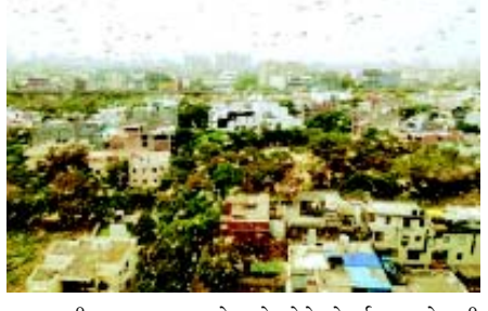
સરકાર તીડના હુમલા મામલે નિર્દેશો બહાર પાડશે.

(એજન્સી) નવી દિલ્હી, તા. ૨૭ ગુરૂગ્રામના નવા અને જૂના વિસ્તારો સહિત સેક્ટર પાંચના રાજેન્દ્ર પાર્ક, સરકત નગર, ઘનવાપુર, પાલમવિહાર, સેક્ટર-૧૮ની મારુતિ ફેક્ટરી, સેક્ટર-૧૭ના ડીએલએફ-૧ ખાતે શનિવારે તીડનું ઝુંડ જોવા મળ્યું હતું. સવારે ૧૧ વાગ્યે તીડોના હુમલાથી ગુરૂગ્રામના લોકો ચોકી ગયા હતા. તીડના હુમલાના પગલે દિલ્હી સરકારે તાકીદની બેઠક બોલાવી હતી. ગુરૂગ્રામના વહીવટી તંત્રએ તીડના હુમલાથી થયેલા નુકસાનની આકરણી શરૂ કરી છે. તાકીદની બેઠક બાદ દિલ્હી